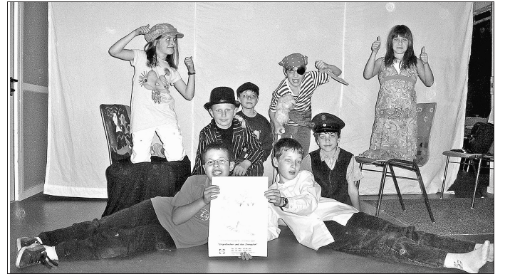
Feibert der Premiere entgegen: die Kindertheatergruppe der Lichtstube Hechingen.

Die Zuschauer erwartet eine abwechslungsreiche und stimmungsvolle Reisegeschichte im Veranstaltungsraum der Lichtstube an der Staig. Die zweite Aufführung ist am Donnerstag, 14. Mai, um 16 Uhr am gleichen Ort.