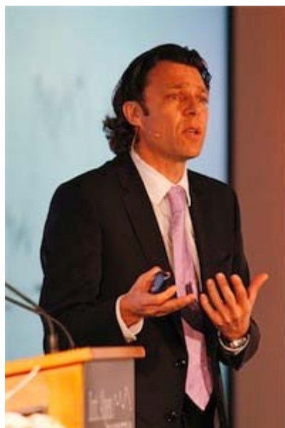
Der ehemalige Fifa-Schiedsrichter Urs Meier übersetzte am Alpsymposium Fussballweisheiten in die Managersprache.

Die Teilnehmer des 9. Internationalen Alpsymposium gingen während zwei Tagen im Victoria-Jungfrau Grand Hotel & Spa der Frage nach den neuen Mächtigen in der Welt auf den Grund. Wird China die neue Supermacht? Wollen Kunden im Marketing mehr Porno? Ist Al Qaida ein globaler Player? Und wie steht es um die Zukunft der Grossbanken? Zwölf Referenten versuchten Antworten zu liefern.