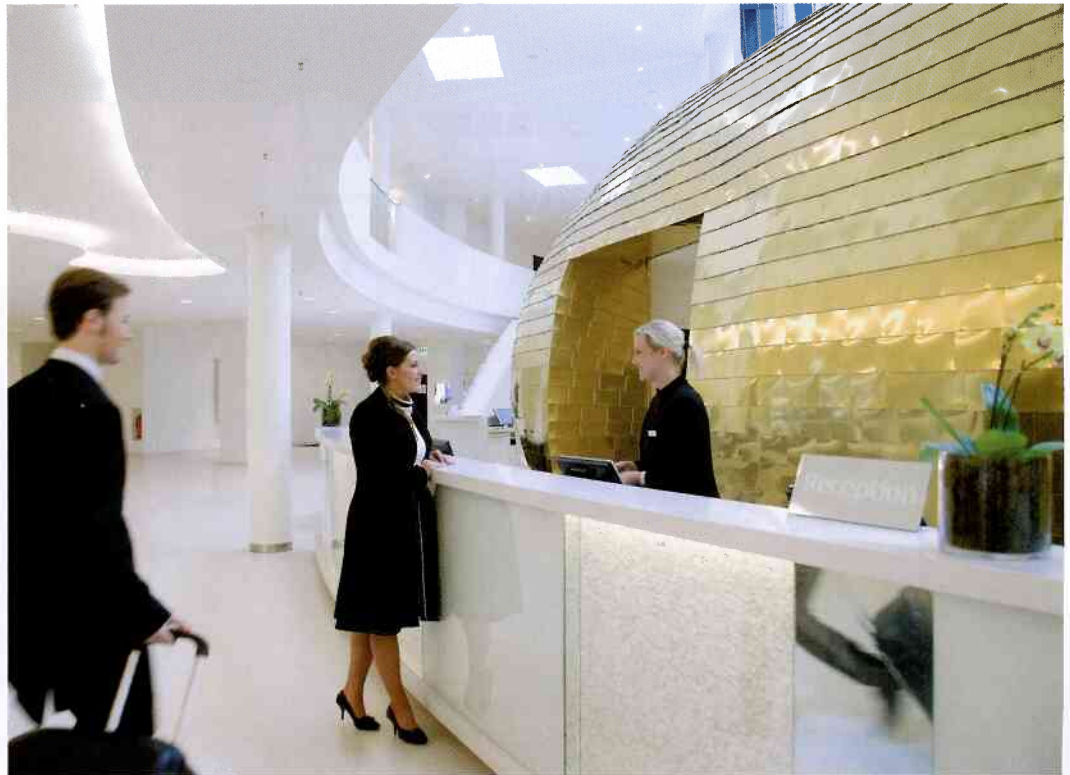
Auf Dienstreisen künftig wieder unsteuerter ins Bett.